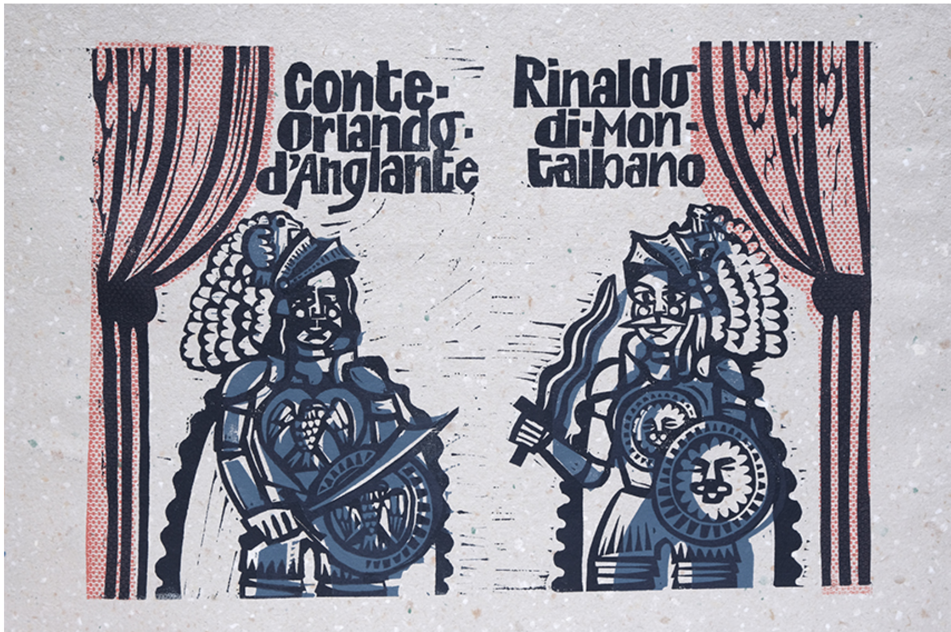
ca. 35x50 cm. 3-Platten. Signierte und nummerierte Sonderausgabe von nur 4 Exemplaren, gedruckt auf handgeschöpftem Spezialpapier aus St. Petersburg, Russland.