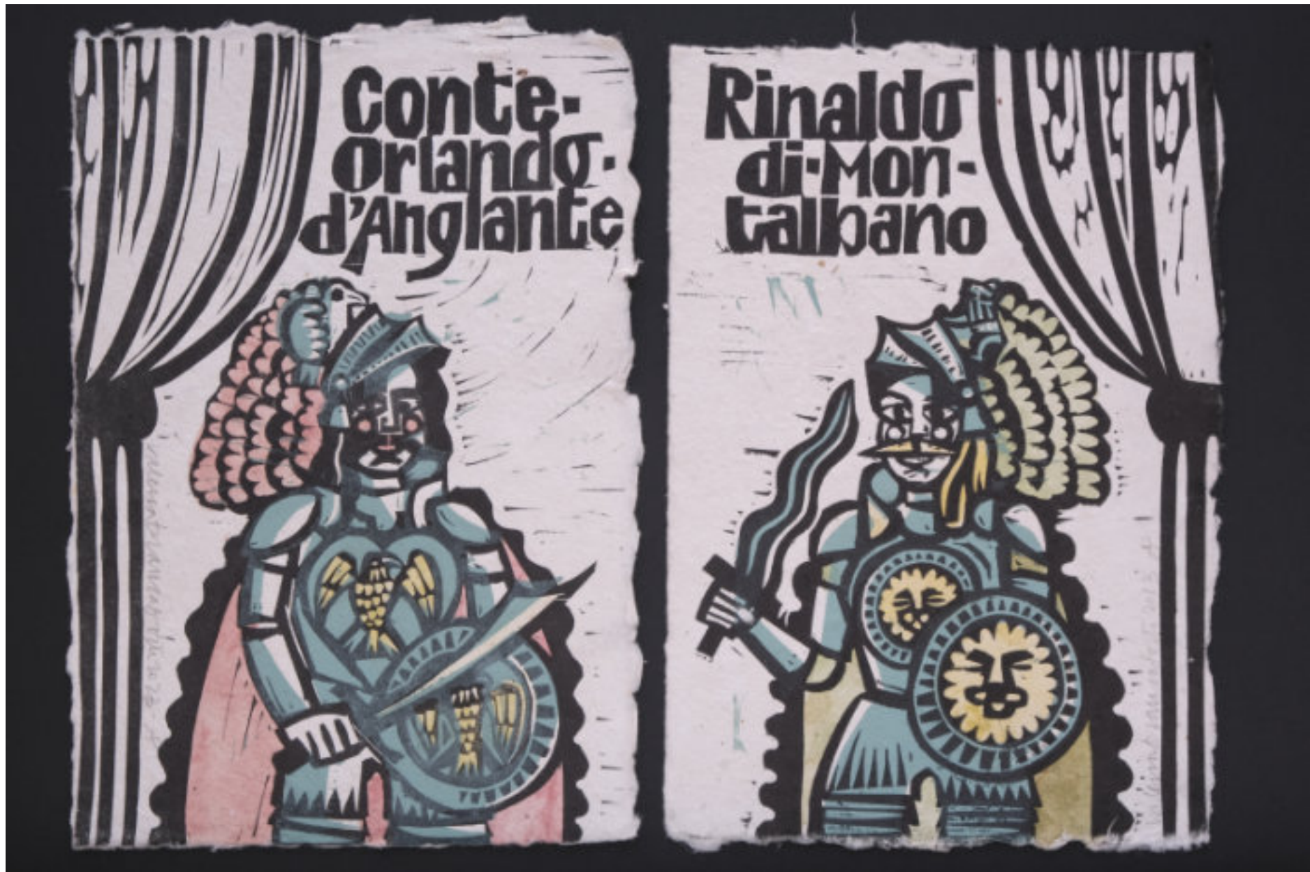
ca. 30x40 cm. Zusammenstellung von zwei 2-Platten-Linolschnitten, gedruckt auf handgeschöpftem Papier aus Katalonien gedruckt und mit handkolorierten Sennelier-Aquarellen angereichert.