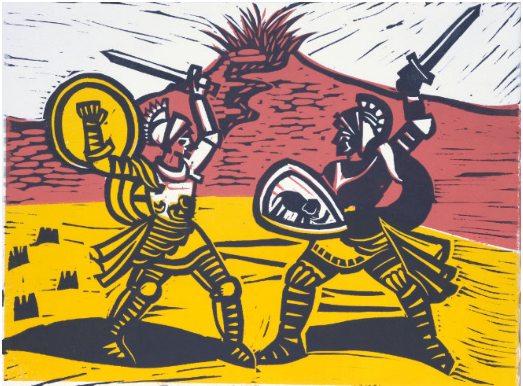
Gefecht von Uzeta und Arcibaldo am Fuße des Ätna. 25x33 cm, 2-Platten-Linolschnitt, getuscht in 3 Farben. Künstlerabzug.