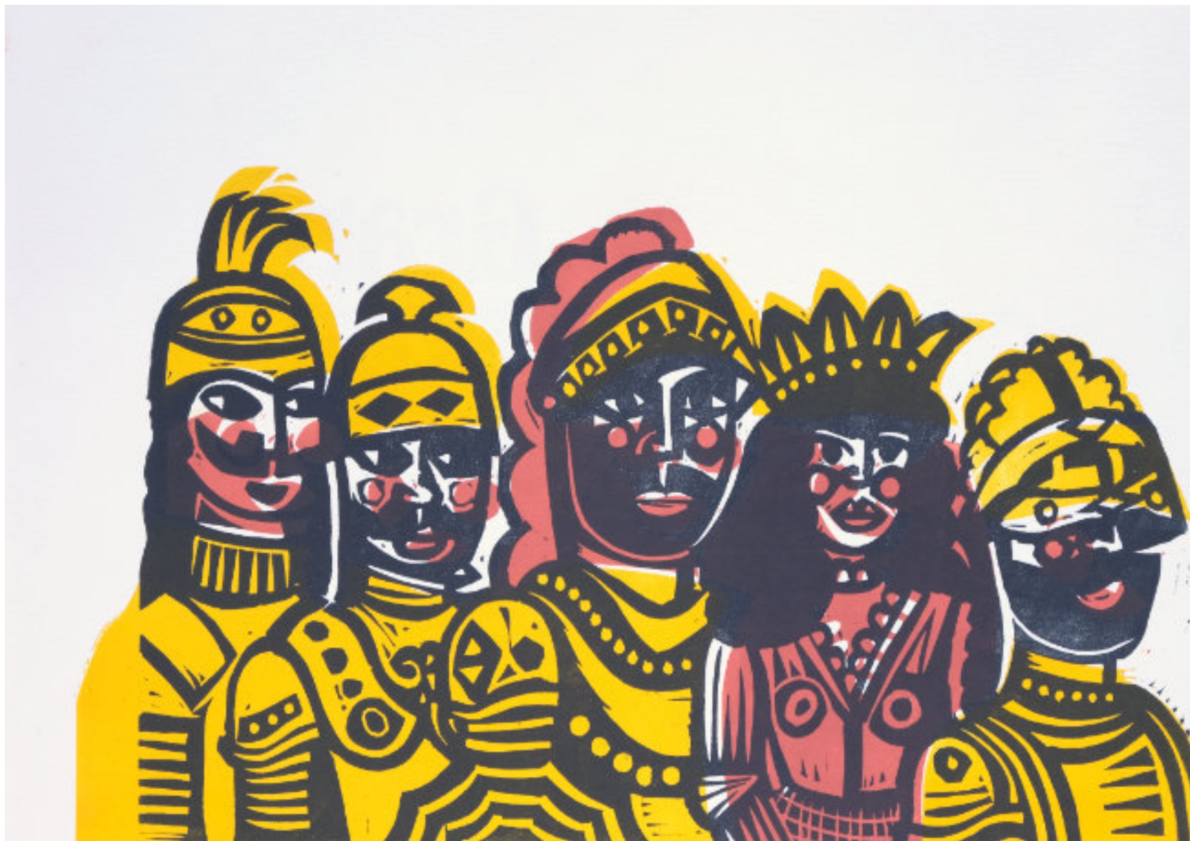
Eine Gruppe Paladine. - 25x33 cm, 2-Platten-Linolschnitt, 3-farbig getuscht. Künstlerabzug.