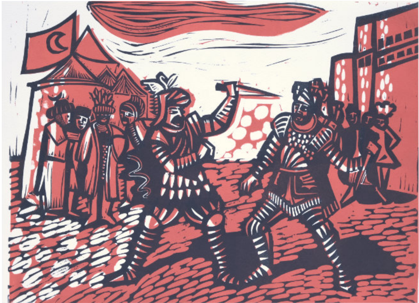
Dolchduell zwischen Rinaldo und Ruggiero 25x33 cm., 2-Platten-Linolschnitt, Künstlerabzüge.