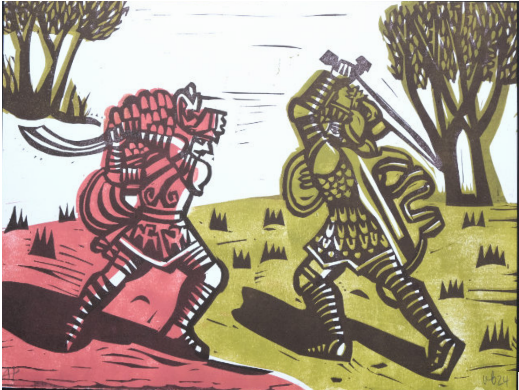
Große Gefecht zwischen Orlando und Rinaldo. 25x33 cm, 2-Platten-Linolschnitt, getuscht in 3 Farben. Künstlerabzug.