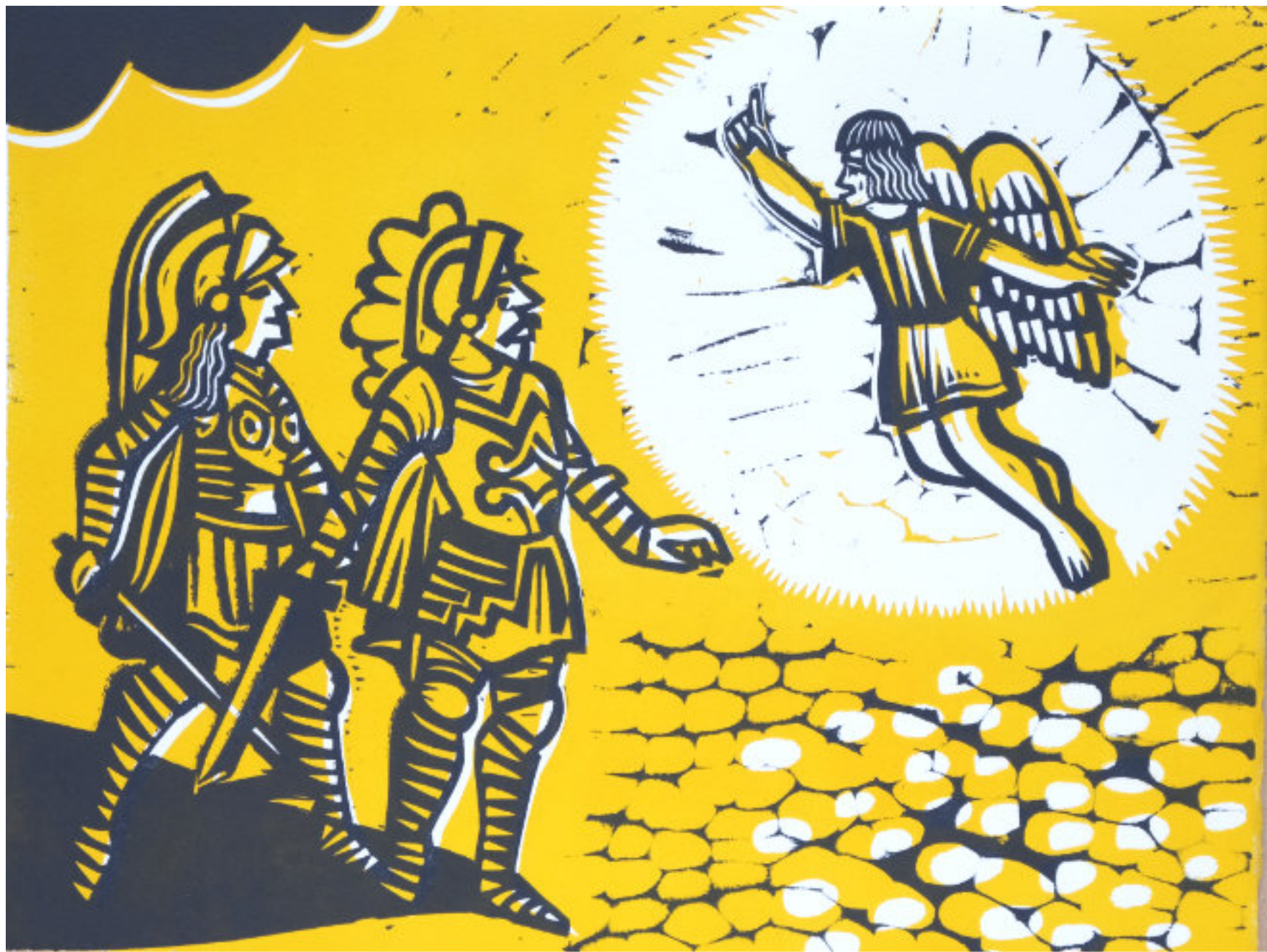
Der Engel zeigt Cladinoro und Marfisa den Weg 25x33 cm ca., 2-Platten-Linolschnitt, Künstlerabzüge.